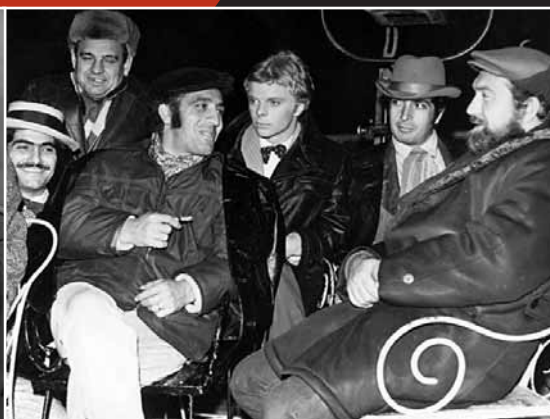
Во время съемок «Неуловимых мстителей»