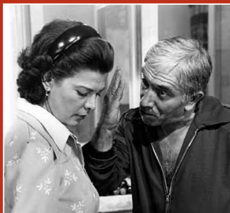
Кадр из кинофильма «Когда наступает сентябрь»